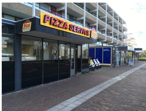
renovaties in voorbereiding